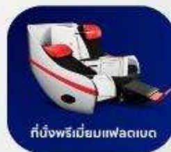
ที่นั่งพรีเมียมแพคเกจ