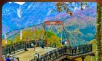
ฮาคุบะอิวากาเกะ