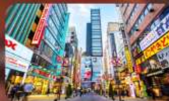
ซ้อปิ้งชินจูกุ