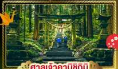
🏯 ศาลเจ้าคามิชิคิมิ