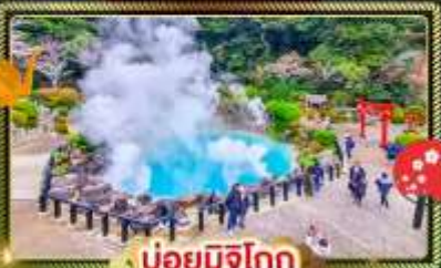
♨️ บ่อน้ำพุร้อน