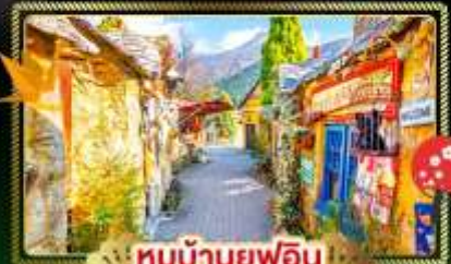
🏠 หมู่บ้านญี่ปุ่น