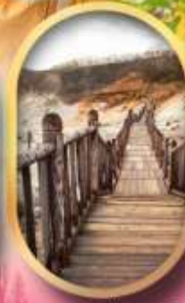
หุบเขาจิกุคาบิ