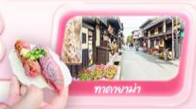
ทาคายามา