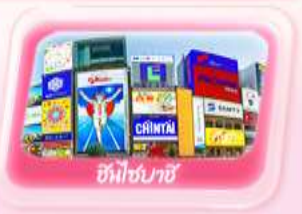
ชินโซบาชิจิ