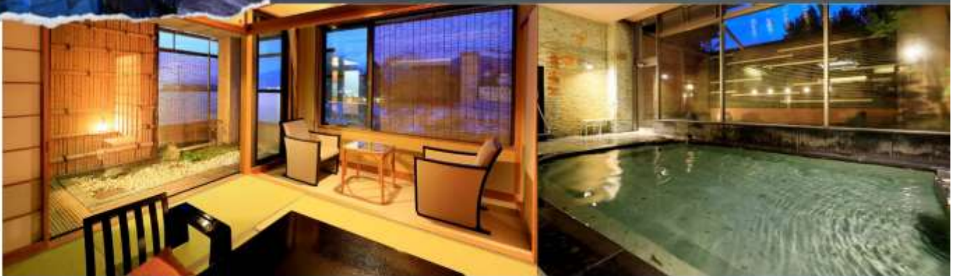
Japanese-style Room 17 sqm