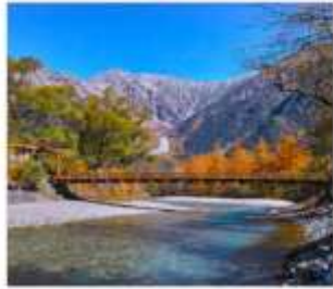
ดามิโดจิ