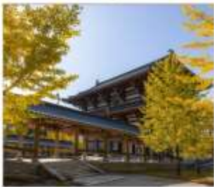
วัดไดชิซังเซอิโดจิ