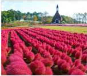
สวนดอกไม้ไม้กกระโนะซาโตะ