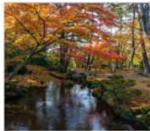
สวนเคนโระคุเอ็น