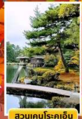
สวนเคนโระคุเอ็น

🍷 ออนเซ็น 3 คั้น 🧳 นน.กระเป๋า 23 กก. ☀️ 7Days 5Night