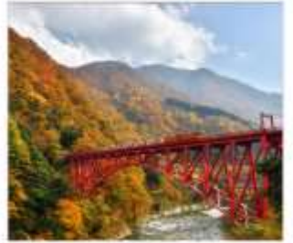
รถไฟชมวิวยุชมเงาคูโรเนะ