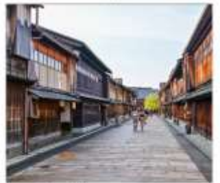
ย่านโรงน้ำชาอิงาชิซายะ