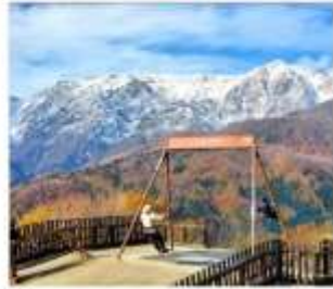
ซาคุบะอิวาทาเกะ