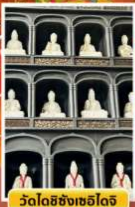
วัดไดชิซังเซอิโดจิ