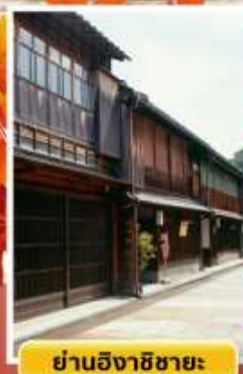
ย่านอิงาชิบายะ