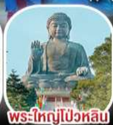
พระใหญ่ไผ่หลิน