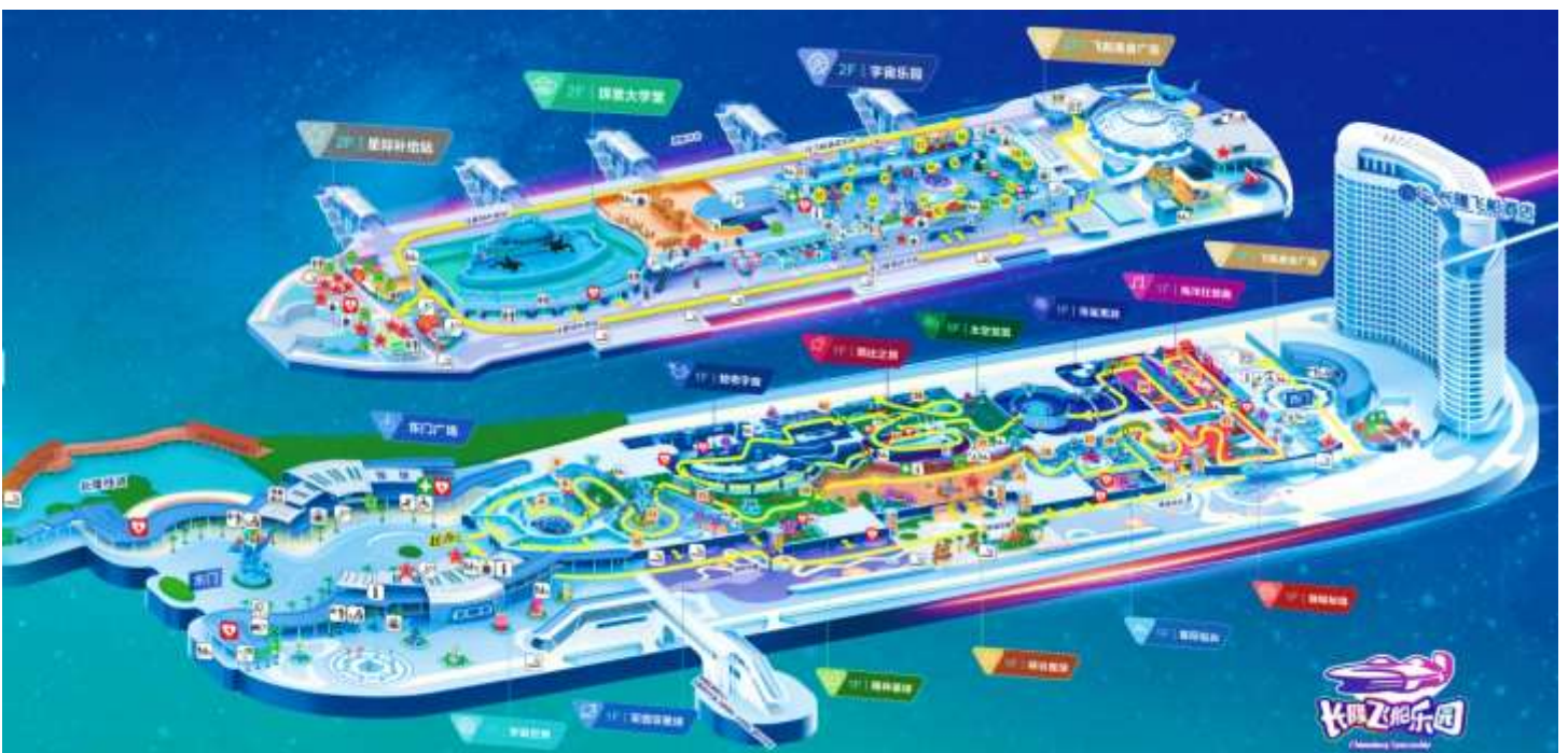
แผนที่ CHIMELONG SPACESHIP PARK