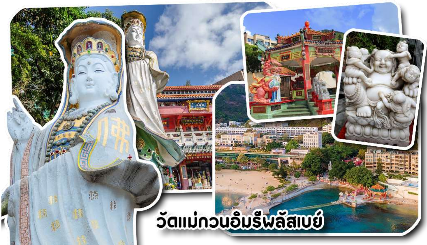
วัดแม่กวอนอิมริฟลัสเบย์

จากนั้นพาท่านเดินทางไปในมัสการ เจ้าแม่กวอนอิมริมหาดริฟลัสเบย์ วัดแห่งนี้ถูกสร้างขึ้นเพื่อ คุ้มครองชาวประมงเวลาออกเรือไปหาปลาในสมัยก่อน บริเวณวัดมีสิ่งศักดิ์สิทธิ์มากมาย ได้แก่ เจ้าแม่กวอนอิม ประดิษฐานอยู่ทางด้านซ้ายของวัด ซึ่งผู้คนนิยมเดินทางไปกราบไหว้ขอพรเรื่องกรรมนิบุตร และยังมีพระสังกัจจายที่ เชื่อกันว่าสามารถขอเพศของบุตรที่จะมาเกิดได้ โดยหลังจากกราบไหว้แล้วก็ให้ลูกที่ท้องของพระสังกัจจาย ถ้าอยาก ได้ลูกชายให้ลูกท้องซ้าย อยากได้ลูกสาวให้ลูกท้องขวา ถัดมาคือ เจ้าแม่ทับทิมเทพีแห่งท้องทะเล ท่านจะคอย คุ้มครองผู้เดินทางทางเรือ หรือผู้ที่เดินทางไปไหนมาไหนท่านจะคอยคุ้มครองให้ปลอดภัย และมีโชคลาภ ถัดจาก บริเวณที่กราบไหว้ขอพร ก็จะมีศาลาแปดเหลี่ยมริมน้ำ และสะพานเล็กๆ ที่ชื่อว่าสะพานต่ออายุ ซึ่งเชื่อกันว่าหากเดิน ข้ามสะพานแห่งนี้ 1 ครั้ง ก็จะมีอายุยืนขึ้น 3 ปี