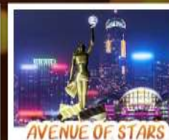
AVENUE OF STARS