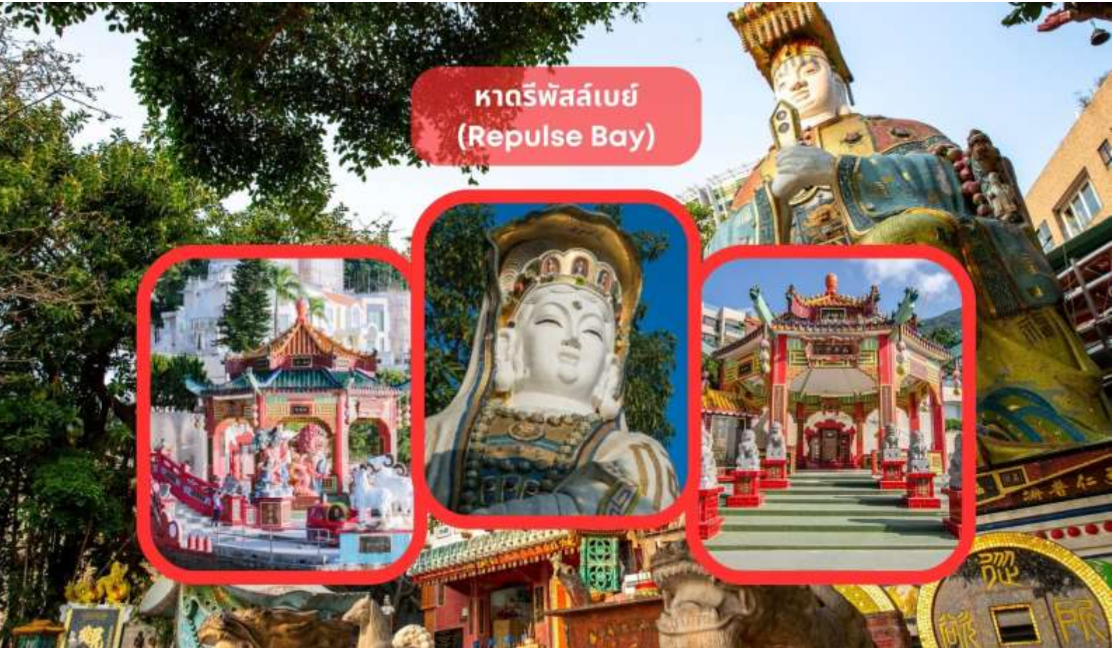
หาดรีพัลส์เบย์ (Repulse Bay)