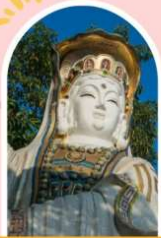
ริพลัสเบย์