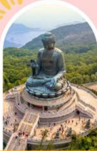
นั่งกระเชานองปิง