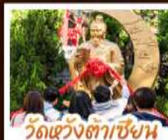
วัดเซ้งงั๋งตาเซ้งน