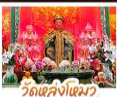
วัดเจ้คังโงเมว

นั่งรถรางฟ้าแตรมสู่ TOP OF PEAK • ซ้อปั้งจู่โงมกั๊ก และ CITYGATE OUTLAETS • นั่งกระช้านองปั้ง สักการะพระใหญ่เทียนตาม • ขอพรเจ้าแม่หล่งโหมว แม่งอง 5 มังกร ให้ประสบความสำเร็จในทุกๆ ค้าน