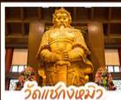
วัดเช้งกั๋งเมว