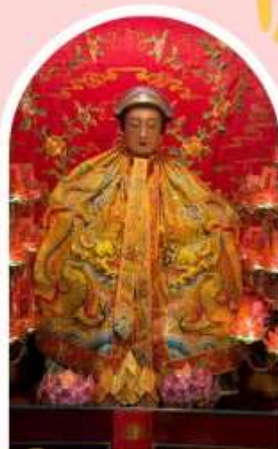
วัดหลังโหมว

ความสำเร็จ ความมั่งคั่ง เงินทองไหลมาเทมา