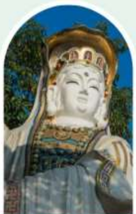
เจ้าแม่กวนอิม ธิพลสเบย์