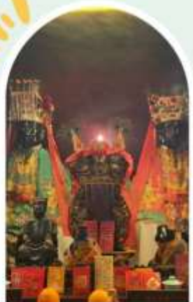
วัดหมิ่นโหมว