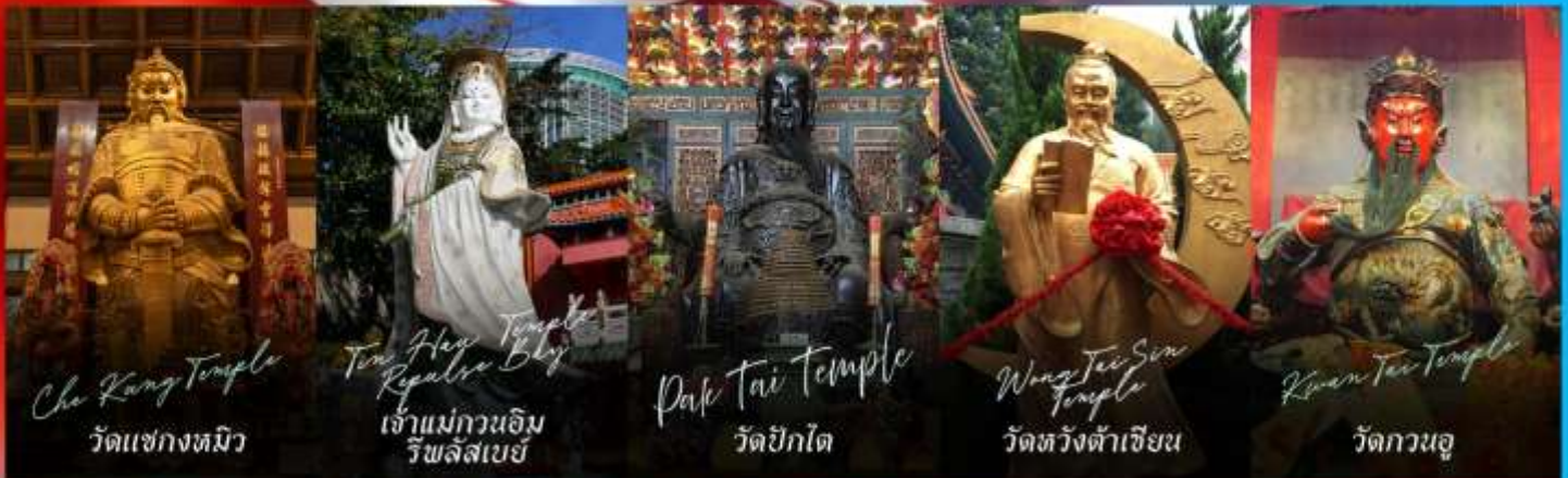
Che Kung Temple วัดแชกงหมิว

รายการทัวร์ข้างต้นอาจมีการปรับเปลี่ยนเพื่อความเหมาะสม