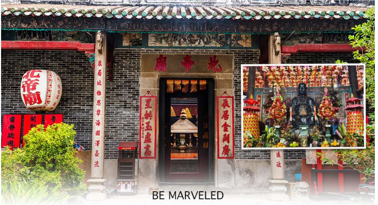
BE MARVELED วัดปักไต้

คนที่เป็นศัตรูของ เราเปลี่ยนใจมาเป็นมิตร เป็นที่นิยมอย่างมากของชาวฮ่องกงมาราบไหว้ขอพรกันที่วัด