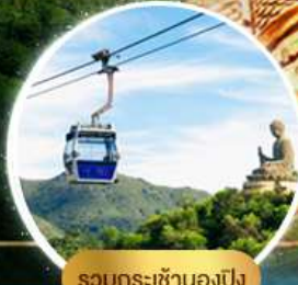
รวมกระเช้ามองปีง