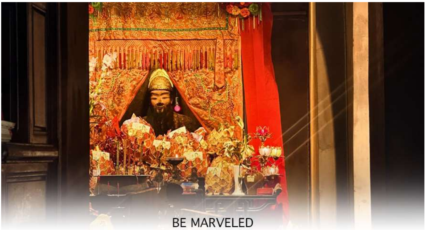
BE MARVELED วัดแซง อนุรักษ์ 600 ปี

ถึง 600 ปี แล้วยังเป็นเพราะเป็นวัดแซงดั้งเดิม เป็นวัดแซงแห่งแรกที่สร้างขึ้นเพื่อบูชาเทพเจ้าแซง ซึ่งคือแม่ทัพแซงวีรบุรุษผู้กล้าหาญและซื่อสัตย์จากสมัยราชวงศ์ซ่งใต้ (ค.ศ. 1127-1279) ซึ่งได้รับการยกย่องจากฮ่องเต้จากวีรกรรมในการปราบกบฏทางตอนใต้ของจีน สาเหตุที่วัดแซงถูกสร้างขึ้นที่นี่ เพราะมีตำนานเล่าว่า ท่านแม่ทัพแซงได้ให้การคุ้มครองจักรพรรดิเจ้าปิง องค์จักรพรรดิองค์สุดท้ายของราชวงศ์ซ่งใต้ ระหว่างการเสด็จหนีลงใต้มาตั้งหลักแหล่งที่นี่ก่อนราชวงศ์จะล่มสลาย ด้วยความซื่อสัตย์และความกล้าหาญเป็นที่ประจักษ์ ชาวบ้านจึงเริ่มบูชาแม่ทัพแซงหลังจากท่านเสียชีวิตลง