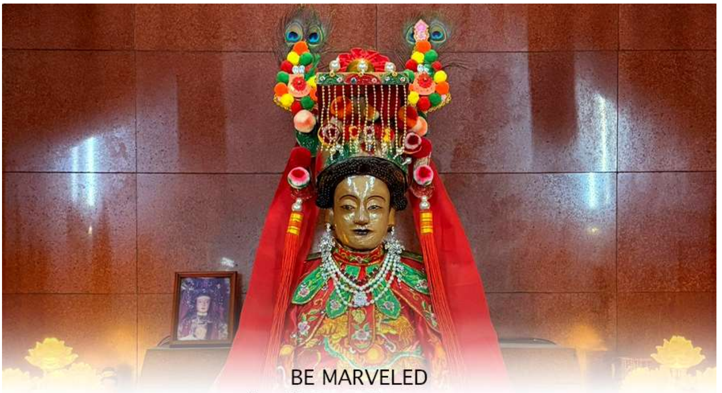
BE MARVELED เจ้าแม่ทับทิม 400ปี Yuen Long

หลังจากนั้นนำทุกท่านเดินทางไปยัง วัดเจ้าแม่ทับทิม 400 ปี เจ้าแม่ทับทิม ผิงซาน – Yuen Long (Ping Shan Tin Hau Temple) อยู่บน Ping Shan Heritage Trail เส้นทางมรดกทางวัฒนธรรมที่สำคัญของฮ่องกง วัดนี้สร้างขึ้นประมาณ ค.ศ. 1712 (สมัยราชวงศ์ชิง) มีอายุมากกว่า 300 ปี และในความเชื่อของชุมชนท้องถิ่นมักเรียกกันว่า วัดเจ้าแม่ทับทิม 400 ปี เพื่อสื่อถึงความเก่าแก่และการบูชาต่อเนื่องหลายชั่วอายุคน สร้างโดยตระกูล Tang Clan หนึ่งใน 5 ตระกูลใหญ่ดั้งเดิมของ New Territories ได้รับการขึ้นทะเบียนเป็น Declared Monument (โบราณสถานสำคัญของฮ่องกง) เจ้าแม่ทับทิม Tin Hau เทพีแห่งทะเล การเดินทาง ความปลอดภัย และความอุดมสมบูรณ์ ชาวประมง พ่อค้า นักเดินทาง นิยมมาขอพรเรื่องความปลอดภัย การค้าขาย ครอบครัวยุ และ สุขภาพ