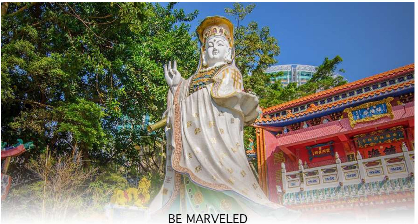
BE MARVELED วัดเจ้าแม่กวนอิมริพัลส์เบย์

การเงิน และขอพรขอ โชคลาภเพื่อเป็นสิริมงคลและขอพร เจ้าแม่ทับทิม หรือ เทพธิดาแห่งท้องทะเล ซึ่งทำหน้าที่ปกป้องกันคุ้มครองชาวประมง ตั้งโดดเด่นอยู่ท่ามกลางสวนสวยที่ทอดยาวลงสู่ชายหาดให้ท่านนมัสการขอ และนำท่านเดินข้าม สะพานต่ออายุ ซึ่งเชื่อกันว่าข้ามหนึ่งครั้งจะมีอายุเพิ่มขึ้น 3 ถ้าข้ามแล้วห้ามเดินย้อนกลับไปเด็ดขาด เพราะคนฮ่องกงเชื่อว่าชีวิตจะสั้นลงไป 3 ปี สำหรับคนโตจะนิยมขอพรกับ เทพเจ้าแห่งความรัก ให้เอามือลูบที่บริเวณหินสีดำ พร้อมกับอธิษฐานให้สมหวังกับความรัก ปิดท้ายด้วยการรับพลังดวงจี้จาก ศาลา แปดทิส ซึ่งถือเป็นจุดรวมรับพลัง ถือเป็นจุดที่มีดวงจี้ดีที่สุดของเกาะฮ่องกง และยังมีรูปปั้นองค์เทพอีกมากมายภายในวัดแห่งนี้ ให้กราบไหว้ขอพร