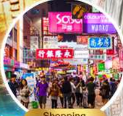
Shopping Taim Sha Tsui