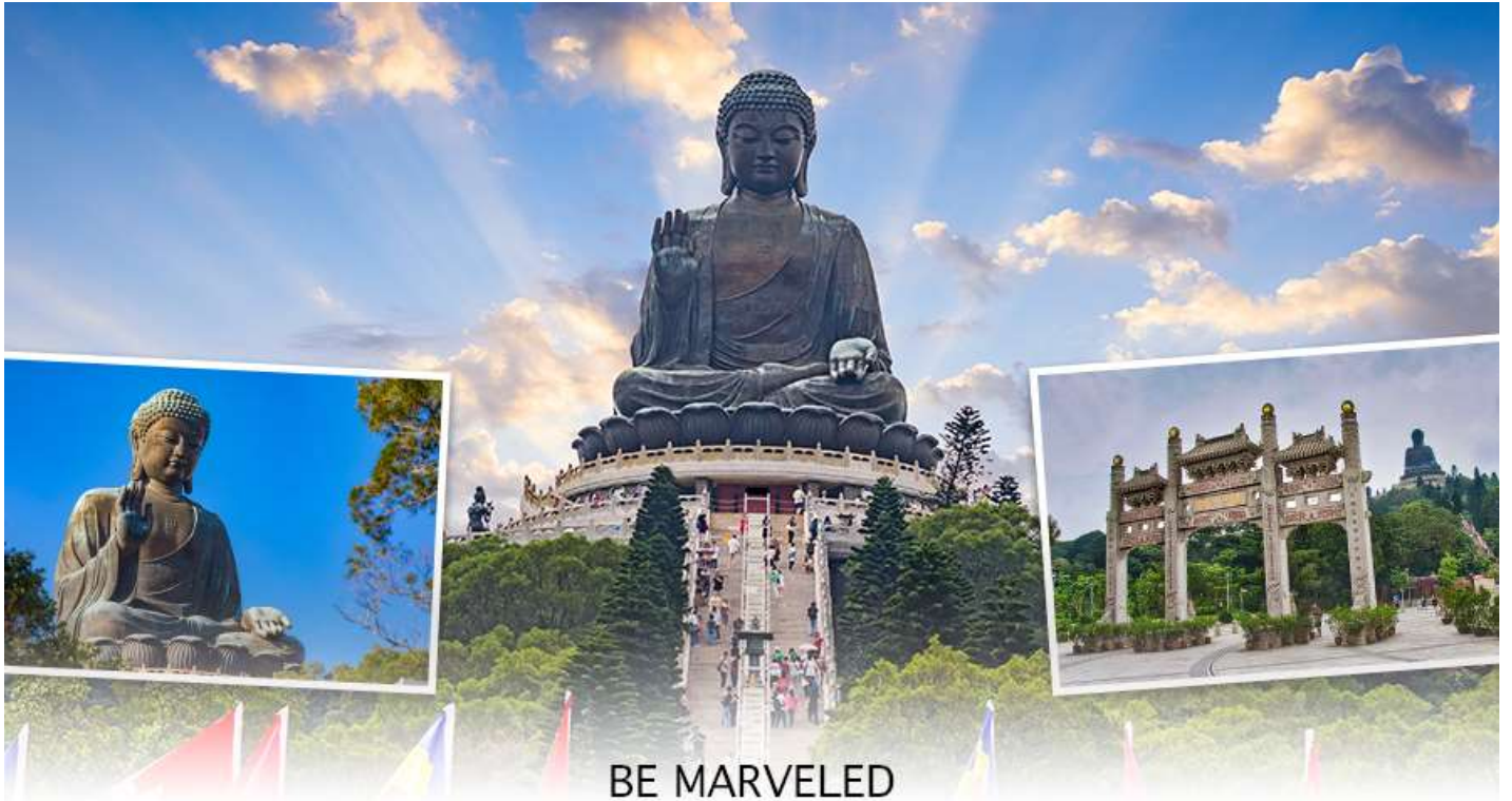
BE MARVELED พระใหญ่เทียนถาน

องค์พระใหญ่แห่งนี้แล้ว ชีวิตก็จะมีแต่ความ โชคดี มีความสุขสมหวัง และประสบความสำเร็จในทุกๆด้าน หลังจากไหว้พระแล้วท่านสามารถเลือกซื้อของฝาก, ของที่ระลึก จากหมู่บ้านนองปิง อาทิเช่น หยก ไข่มุก หรือ เครื่องประดับคริสตัล เพื่อเป็นของที่ระลึก จากนั้นนั่งกระเช้ากลับลงมายังสถานีตุงซุง