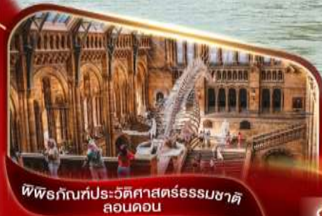
พิพิธภัณฑ์ประวัติศาสตร์ธรรมชาติ ลอนดอน