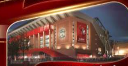
สนามแอนฟิลด์