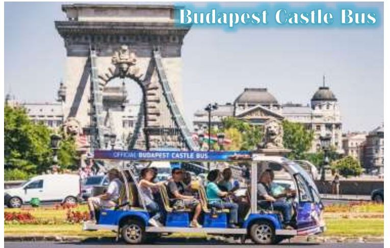
Budapest Castle Bus

บูดา Castle Hill *เนื่องจากตัวปราสาทตั้งอยู่บนเนินเขา การเดินทางโดยรถไฟไฟฟ้า จะเพิ่มความสะดวกสบายให้กับท่าน โดยรถไฟไฟฟ้าจะจอดรับและส่งตามจุดต่างๆ ในย่านเมืองเก่า ไม่ต้องเดินเท้าเป็นระยะทางไกล* จากนั้นนำท่านเดินชมความงดงามของเมืองเก่ารอบๆปราสาทบูดา ที่เริ่มมีการก่อสร้างมาตั้งแต่ปี ค.ศ.1265 และต่อเติมปรับปรุงมาโดยตลอด จนกระทั่งปัจจุบัน โดยตัวอาคารในปัจจุบันเราจะเห็นเป็นสไตล์บาโรค ที่ดู