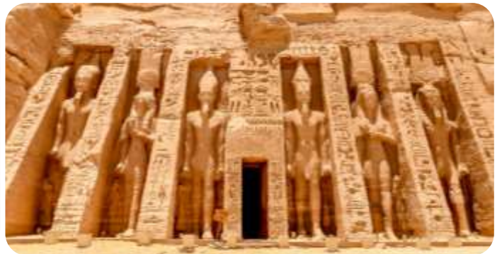
สมควรแก่เวลานำท่านเดินทางกลับเมืองอัสวาน