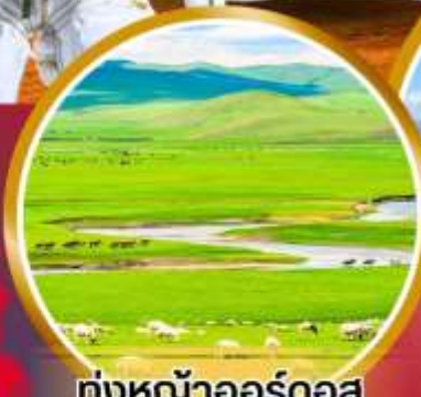
ทุ่งหญ้าออร์โดส