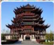
วัดดงหยวน