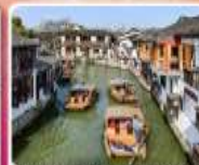
หมู่บ้านโบราณจูเจียเจี๋ย + ล่องเรือ