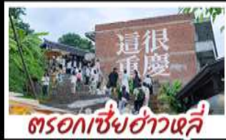
ตรอกเซี่ยฮ่าวหลี่