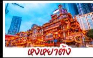
เฉิงชิ่ง