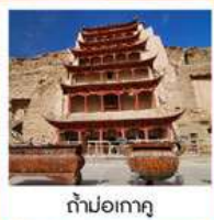
ท่าม่อเถา