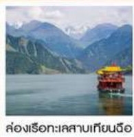
ช่องเรือทะเลสาบเทียนฉือ