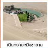
เป็นทรายหมีงาช้าง