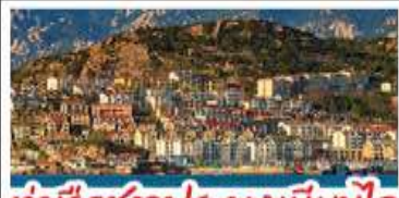
ท่าเรือชาวประมงเยียนโก