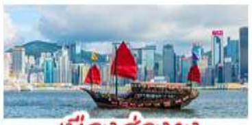
เมืองอ่องกง

เมืองเก่าชิงเต่า - วิวเมืองอ่องกง โรงเบียร์ชิงเต่า - ท่าเรือชาวประมงเยียนโก