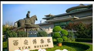
พิพิธภัณฑ์ซีอาน