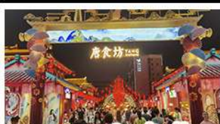
ถนนคนเดินต้าถิง