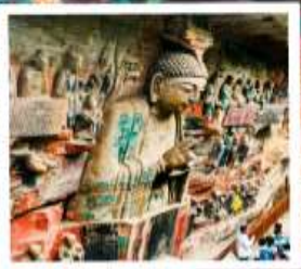
พาหินแกะสลักต้าจู้