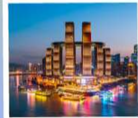
ตึกรูปเฟี๊