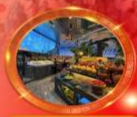
มือพิเศษ บุฟเฟต์นานาชาติ