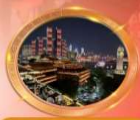
มือตำร้านอาหารวิวหลักล้าน