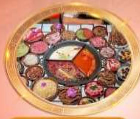
บุฟเฟต์หมีโพล่งซิ่ง