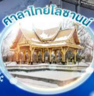
ศาลาไทยโลซานน์