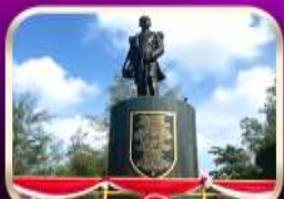
อนุสาวรีย์กรมหลวงชุมพรฯ