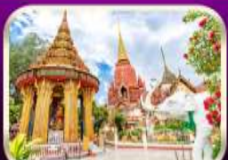
หอพระหลวงปู่ทวด วัดช้างให้