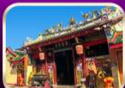
ศาลเจ้าแม่ลิ้มกอเหนี่ยว

ที่เที่ยวเพิ่มขึ้น และ ช่วยฟื้นฟูเศรษฐกิจขนาดใหญ่