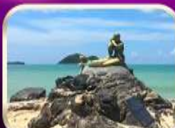
เที่ยวหาดสมิหลา สงขลา