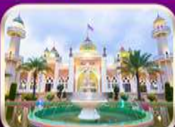
ชมมัสยิดกลางปัตตานี