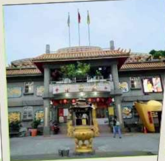
วัดจินชาน (โซคลาก)