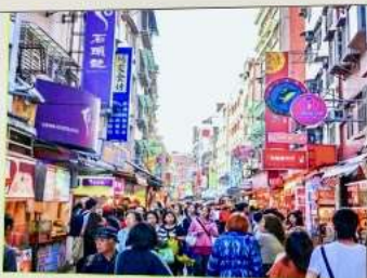
ถนนโบราณตีนส่วย