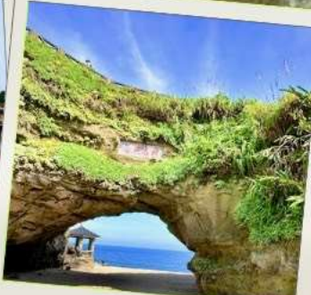
ถ้ำซือเหมิน