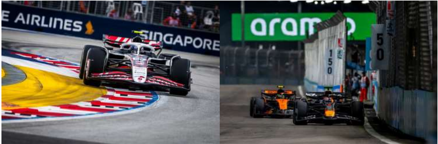
ชม รอบ SPRINT RACE + QUALIFYING

**เดินทางด้วยตนเอง เข้าร่วมงาน FORMULA 1 SINGAPORE GRAND PRIX 2026**